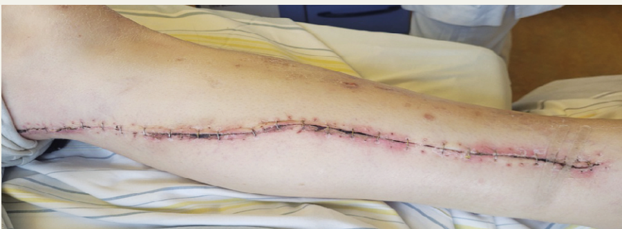
Vergleich der endoskopischen Venenentnahme und der konventionellen Venenentnahme