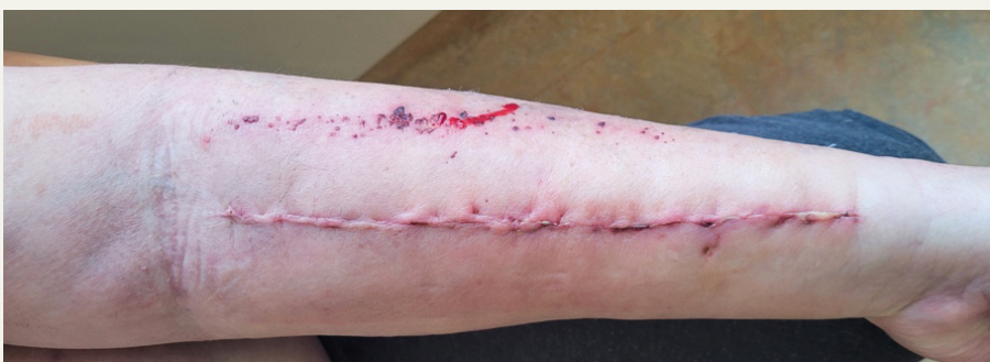
Vergleich der endoskopischen Radialisentnahme und der konventionellen Radialisentnahme

A uch in der Herzchirurgie hat sich dieser Paradigmenwechsel deutlich etabliert. Die aortokoronare Bypassoperation (CABG) stellt weiterhin einen zentralen Bestandteil der Behandlung der koronaren Herzkrankheit dar. Neben der eigentlichen Revaskularisation rückt jedoch zunehmend die möglichst schonende Durchführung aller Operationschritte in den Fokus – insbesondere die Entnahme der Bypassgefäße.